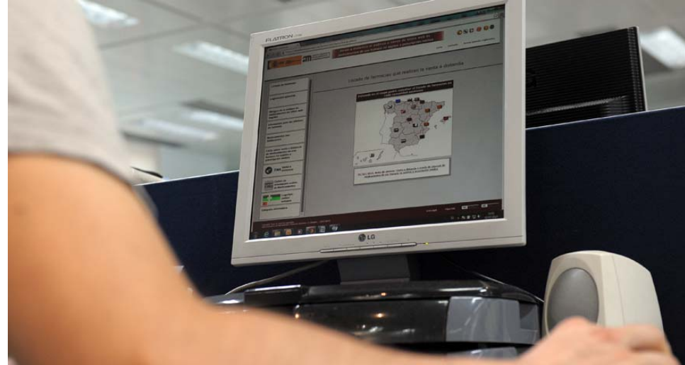
Las primeras autorizaciones a oficinas de farmacia para que puedan llevar a cabo la venta de medicamentos de uso humano no sujetos a prescripción médica a través de Internet se concederán a mediados de julio.

Sobre este particular, cabe destacar que durante el último mes la Aemps ha suscrito con todas las comunidades autónomas convenios de cesión de uso y