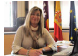
Patricia Gómez, consejera de Sanidad

de Baleares: "No puede primar solo el precio, sino garantizar los resultados en salud"