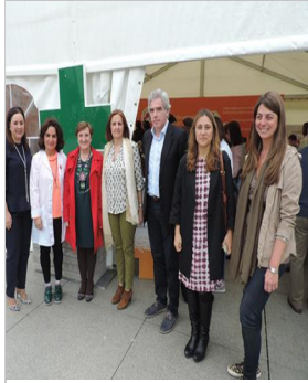
SEFAC y ratiopharm muestran en Santander el potencial de los serv... www.imfarmacias.es