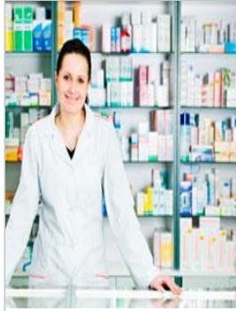
Las farmacias subrayan la importancia de los delegados como pieza... www.imfarmacias.es