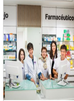
“Es necesario diferenciarse, tanto en imagen como en espe... www.imfarmacias.es

AddThis ( //www.addthis.com/website-tools/overview?utm_source=AddThis%20Tools&utm_medium=image&utm_campaign=Recommended%20content%20logo )